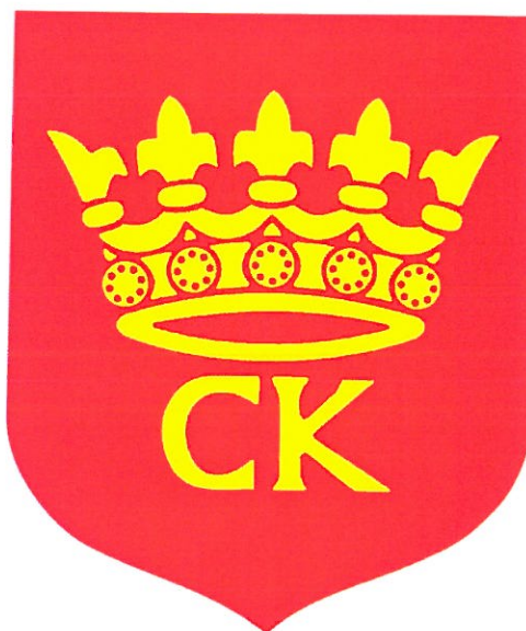
Herb Miasta Kielce